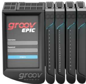
groov EPIC™ Edge Programmable Industrial Controller

La automatización industrial es un pilar fundamental para las empresas en Perú. Con la creciente demanda de productos y la necesidad de mantener altos estándares de calidad , las organizaciones enfrentan la presión constante de mejorar la eficiencia y reducir costos operativos. En este contexto, estas soluciones se presentan como una oportunidad para impulsar el progreso en la industria peruana.